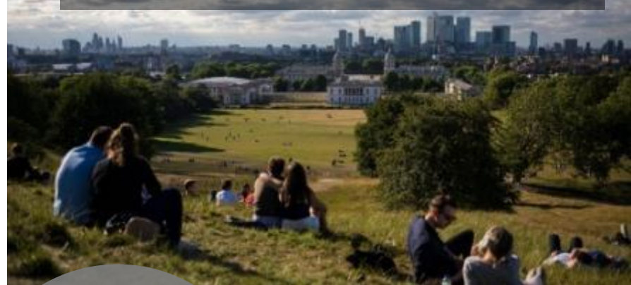
ロンドン国立公園都市宣言