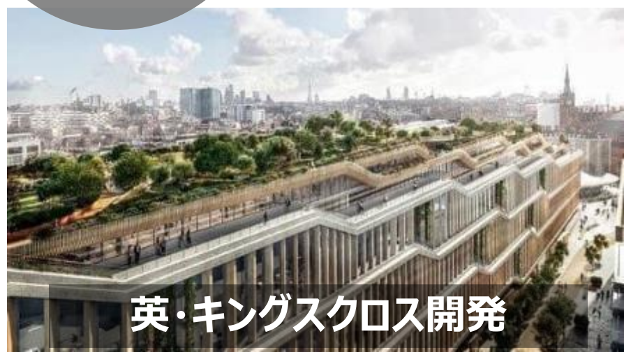
英・キングスクロス開発